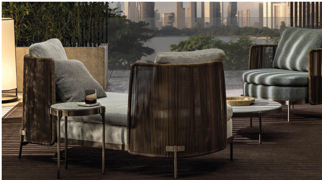
▲ Divano Tape Cord Outdoor