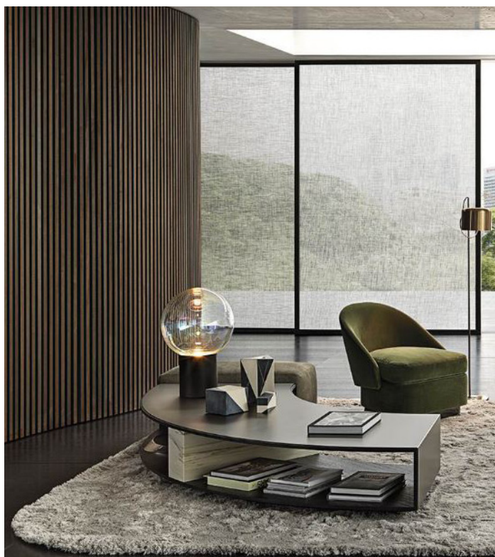
▲ Tavolino Amber

L'azienda nasce nel 1948 da un'idea di Alberto Minotti e, da artigianale, si trasforma in una struttura a carattere industriale. Rimane un'azienda di famiglia e ben presto si apre verso i mercati internazionali.