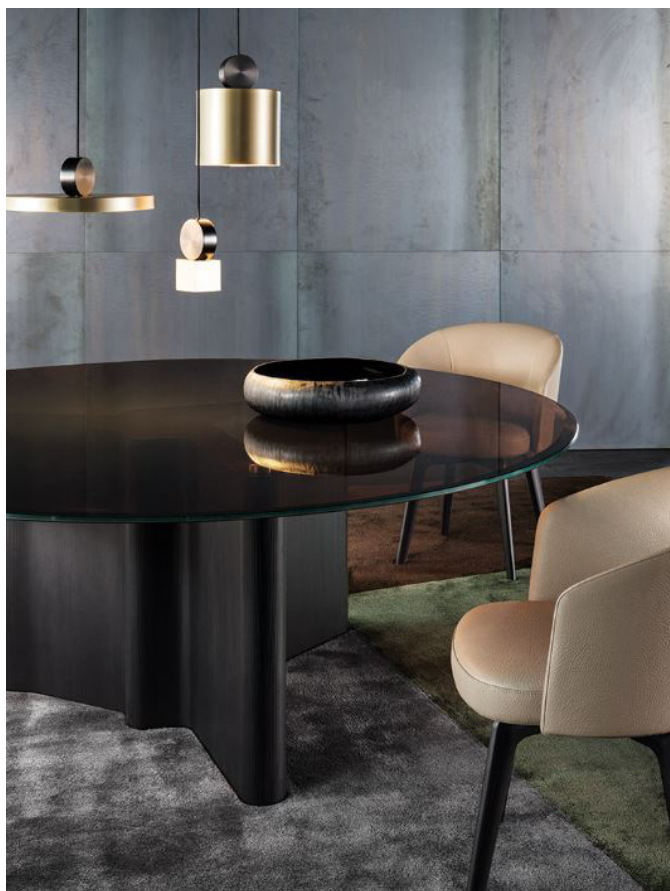
▲ Tavolo Lou Dining

Un elemento in cuoio che abbraccia la struttura come un bustier scultoreo ed al suo interno un'accogliente seduta. Un avanzato processo tecnologico realizzato con due stampi in Baydur che segue perfettamente la sinuosità della struttura.