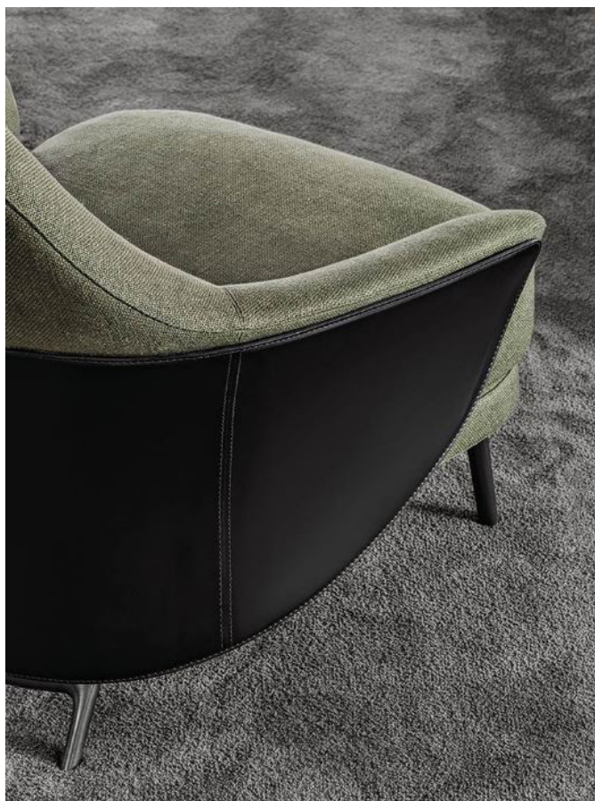
▲ Poltrona Angie - Studio Gam Fratesi

Con il suo stile, Minotti intende dare continuità alle collezioni cogliendo ogni stimolo che proviene dal mondo esterno trasformandolo in progetto, in un'immagine, in evoluzione tecnologica.