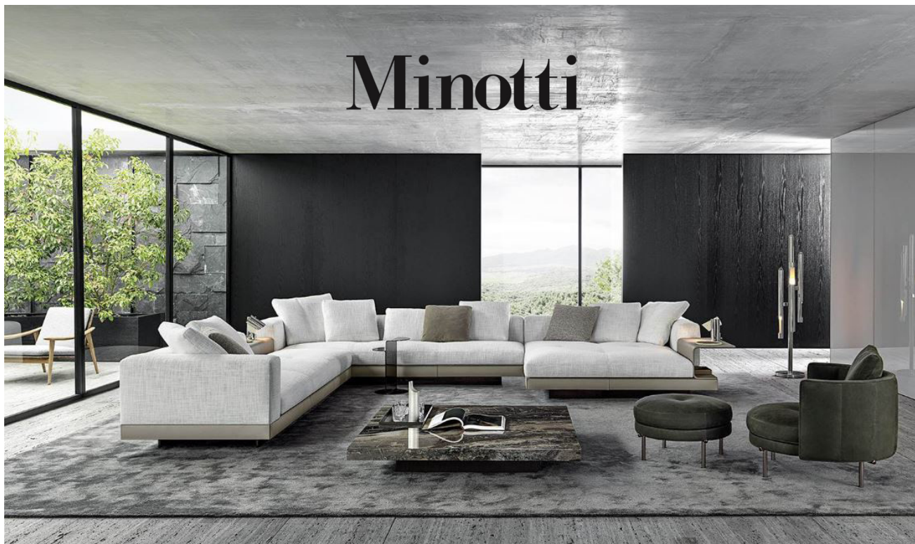
▲ Divano Connery - collezione 2020

Minotti è riconosciuta a livello internazionale come un'eccellenza del Made in Italy nel settore dell'arredamento contemporaneo del Lusso.