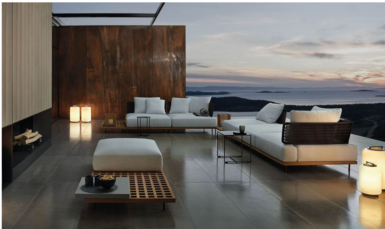
▲ Collezione Quadrado