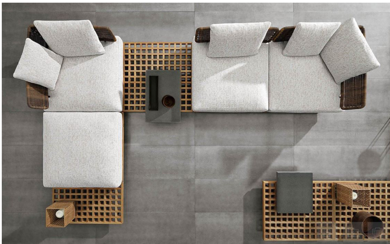
▲ Collezione Quadrado