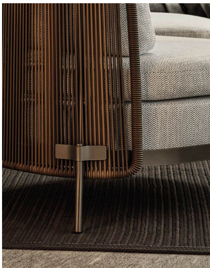
▲ Dettaglio divano Tape Cord Outdoor

La collezione Tape Cord Outdoor propone un sistema di sedute, piani di appoggio e tavoli che bene si integrano nella natura circostante ed invitano alla convivialità.