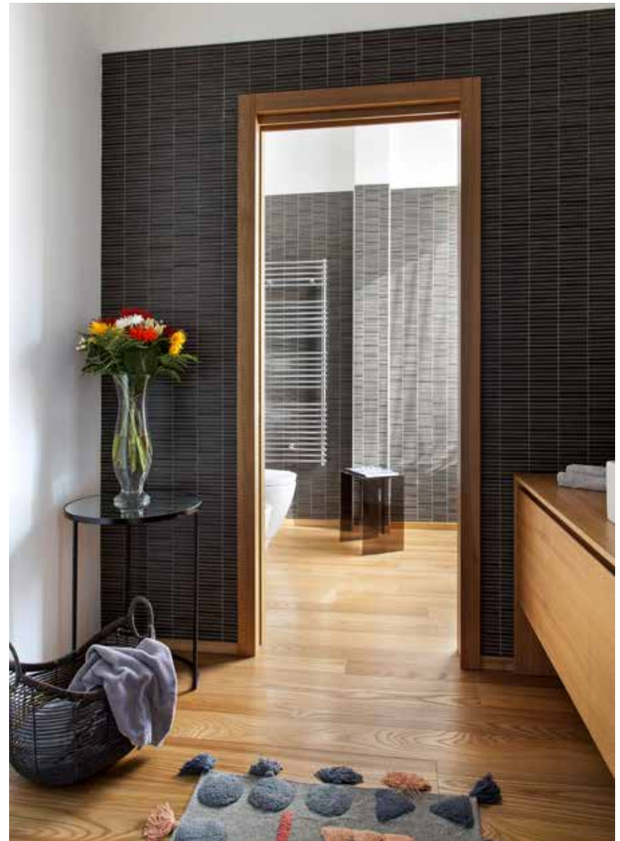
Sopra: il bagno privato conserva la stessa eleganza vista in tutta l'abitazione, con il particolare della vasca d'appoggio a centro stanza (Casa Amica Genesin) . A destra: scorcio del bagno con mobile sospeso realizzato a misura su disegno dell'arch. Genesin.