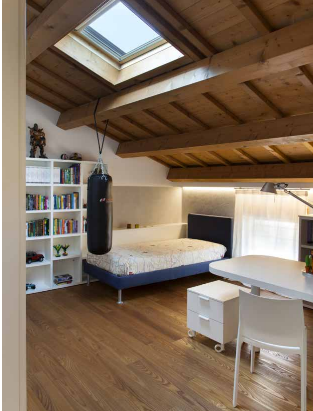
Una delle camere singole, vista cielo, arredata in stile moderno con letto Notturmo di Flou e arredi realizzati su disegno dell'architetto Luca Genesin.