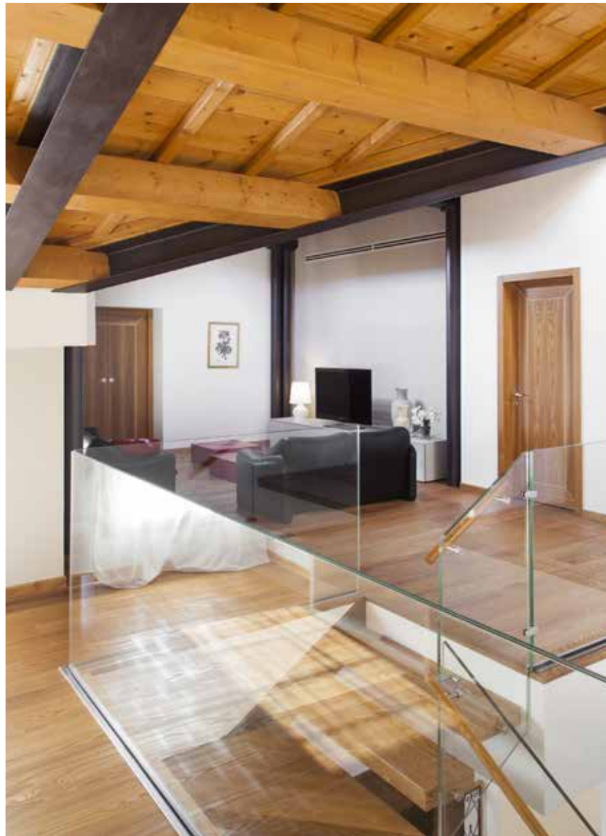
Camera padronale in suite, con letto in pelle bianca e comodini abbinati che spiccano nelle avvolgenti essenze lignee del parquet e delle travi a vista del soffitto. A lato: la trasparenza del parapetto in cristallo lascia in vista il salotto con zona TV che fa da anticamera alle stanze.