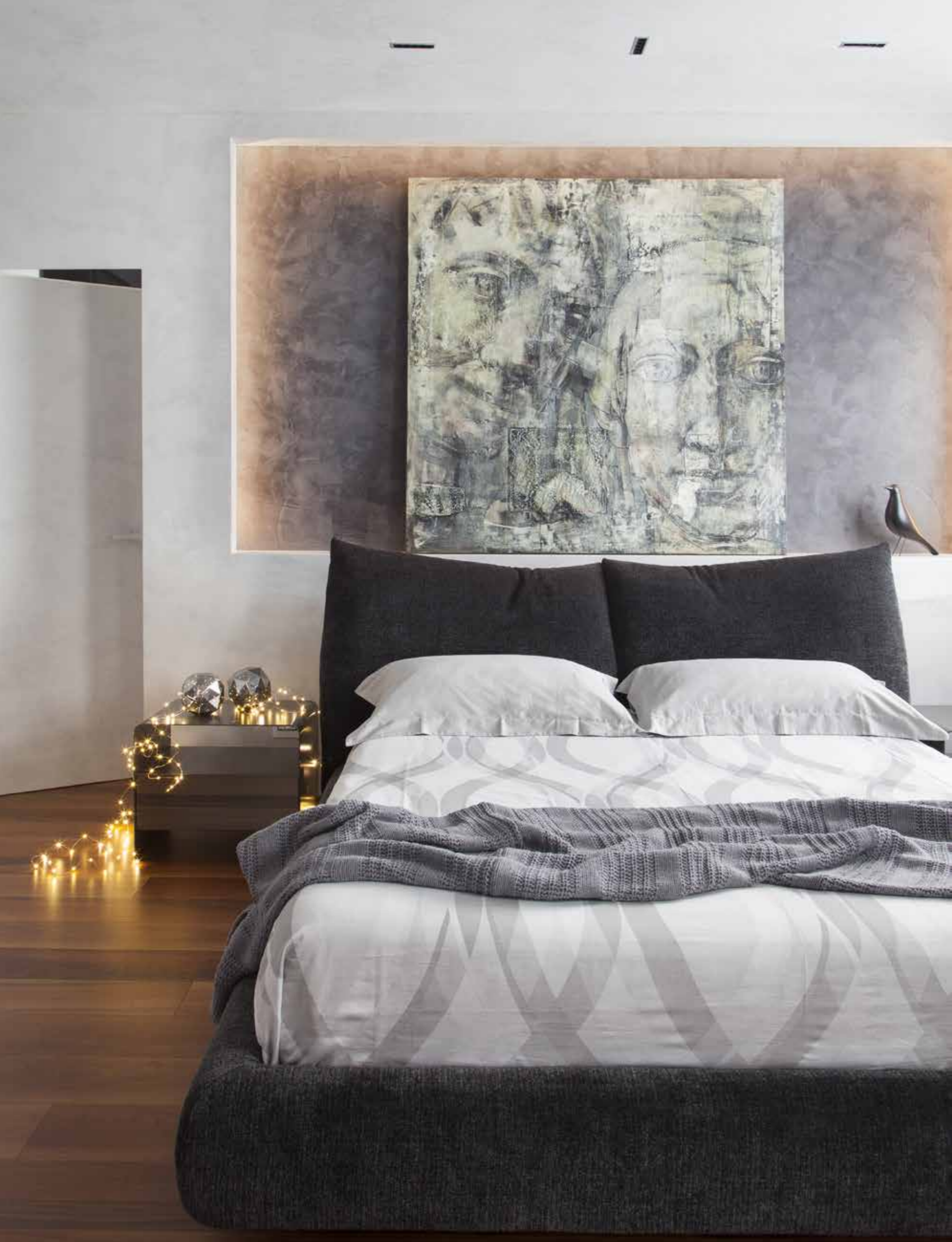
A sinistra: camera padronale dove eleganza, morbidezza e comfort sono espressi dal progetto Stand By Me di Edra. Sopra: camera del figlio dove prendono vita antichi racconti di mare, abitati da animali maestosi che emergono da particolareggiate carte nautiche. Il tema marino, coi suoi colori, è ripreso nel rivestimento del letto, protagonista di questo spazio, e nei dettagli degli arredi che lo circondano. Camera della figlia: la natura incontaminata e fiabesca fa da sfondo al letto Mercurio di Flou e la carta da parati cela un'apertura nell'ampio bagno attiguo (Genesin casa amica).